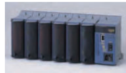
データアキュジションユニット「MX100」