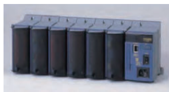
データアキュイジションユニット「MX100」