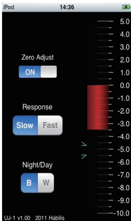
夜間モード表示例