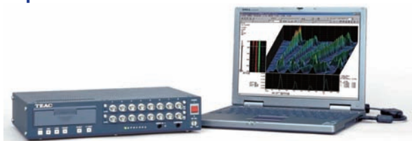
TEACレコーディングユニットLX-100シリーズ用