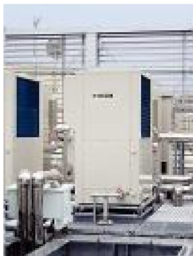
業務用エコキュート